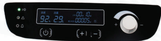
écran LED clair haute définition